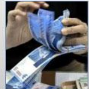
MENABUNG DALAM JUMLAH BESAR

Lupakan MITOS yang mengatakan bahwa Perencanaan Keuangan hanya dibutuhkan oleh orang - orang KAYA !