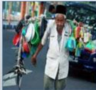
TETAP BEKERJA DI USIA TUA