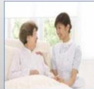
HIDUP BERGANTUNG PADA ANAK