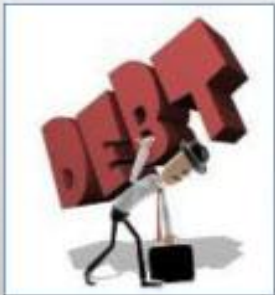
MENCARI SUMBER HUTANG